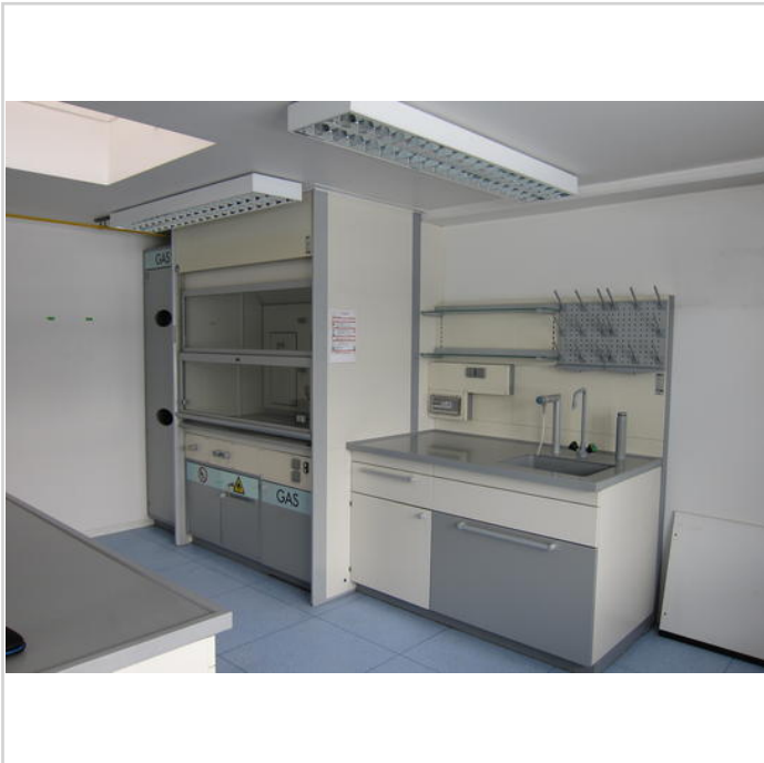
Labor mit Abzug