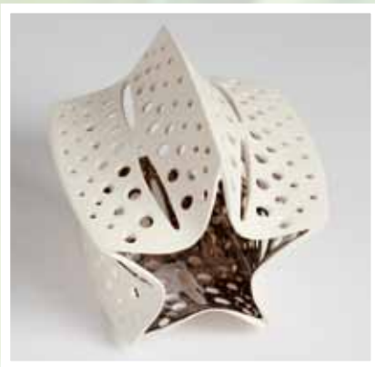
Der Bionic-Award Inspiration: Kieselalge Materialien: Porzellan und Platin

Im Jahr 2012 wird zum dritten Mal der internationale Bionic-Award vergeben. Die festliche Preisverleihung findet während des Bionik-Wirtschaftsforums 2012 statt. Informationen dazu werden den Bewerbern rechtzeitig mitgeteilt und werden auf der Homepage des internationalen Bionic-Awards zu finden sein. Während dieser Veranstaltung besteht die Gelegenheit, die prämierte Arbeit vorzustellen.